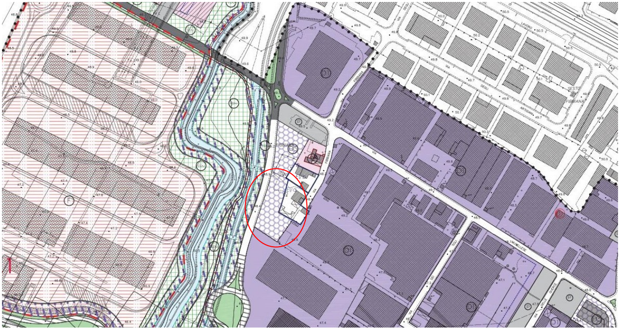
Estratto di Regolamento Urbanistico