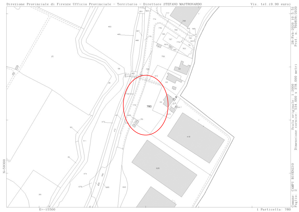
Estratto di mappa catastale