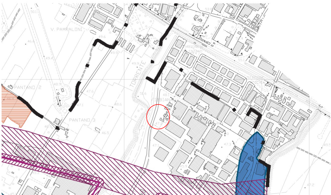
Estratto ricognizione dei vincoli di Piano Strutturale